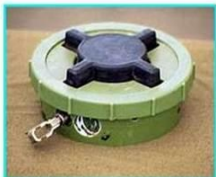
Рис.1 Общий вид мины ПМН-2

ПМН-2 Противопехотная мина нажимного типа