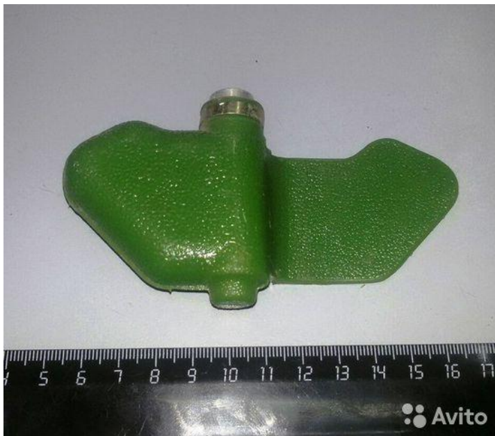
«Мина – ЛЕПЕСТОК» в боевом положении на земле (присыпана грунтом):